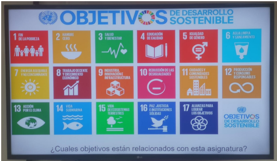
Evidencia 2: Presentación sobre salud y bienestar por parte de los estudiantes